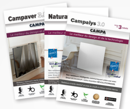
Les fiches techniques