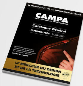
Le catalogue général Campa