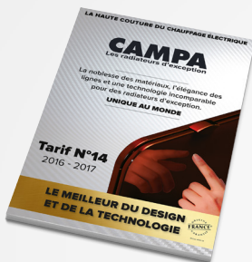
Le tarif Campa